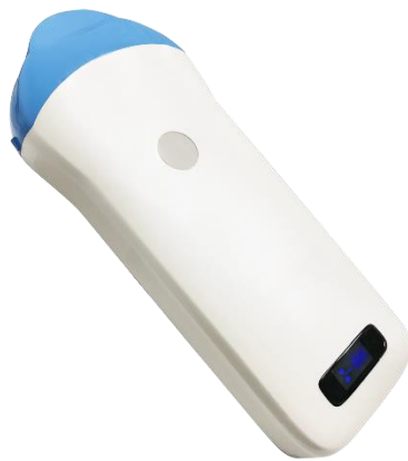
(圖 1-1) X7 超音波凸陣列測孕器 (WiFi 無線) 系統