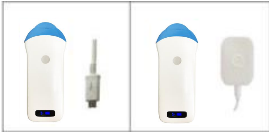
(圖 4-1) 為探頭充電

將本產品頂端之橡膠防水蓋拉出，USB 充電線插入充電孔以進行充電 (見圖 4-1)。