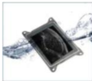
iPad 防水袋(選配) (顏色以現貨為主)