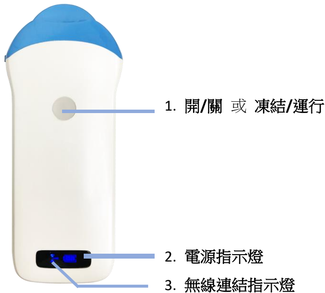
(圖 2-1) 超音波凸陣列測孕器 X7 (WiFi 無線)